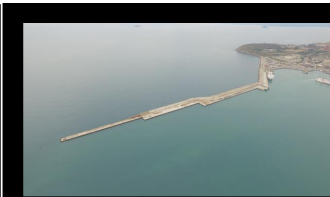
Situazione a Febbraio 2018

L'importo lavori al netto del ribasso d'asta, comprensivo di progettazione, esecuzione lavori e somme a disposizione dell'Amministrazione è pari € 17.604.250,00.