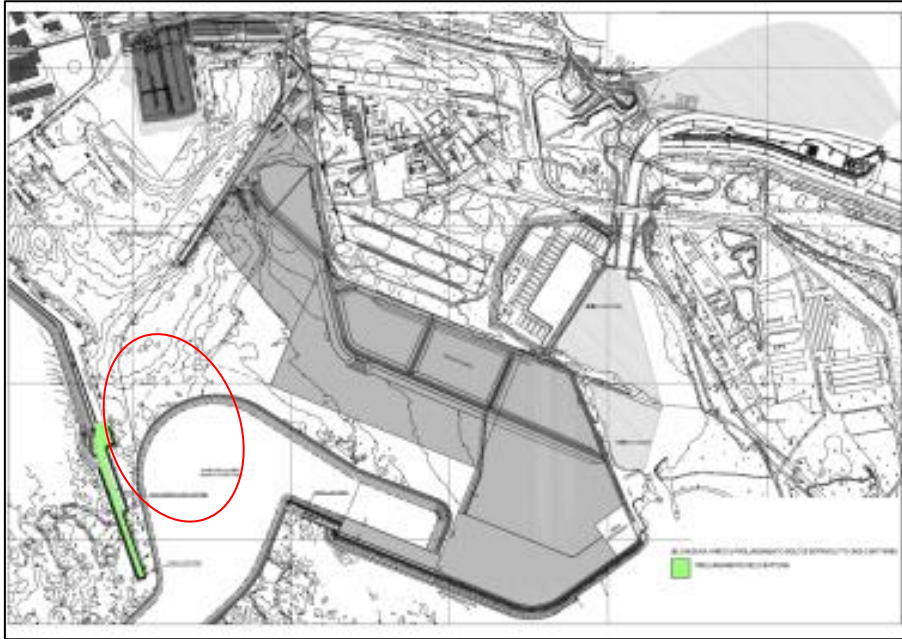
Raccordo e del Prolungamento del molo Batteria

L'intervento aveva per oggetto la chiusura del varco compreso tra la testata del molo Batteria esistente e l'opera di prolungamento a cassoni già realizzato, il completamento della sezione del molo nel tratto di prolungamento e l'ulteriore prolungamento di circa 215 m del molo, così da raggiungere una lunghezza complessiva dell'opera di prolungamento rispetto alla testata della Diga sopraflutto esistente pari a circa 430 m.