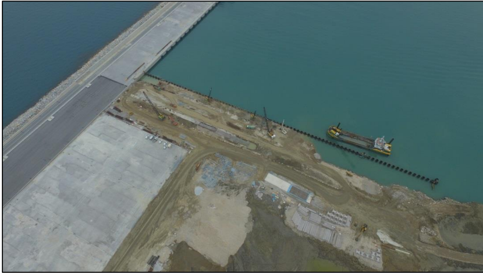
Situazione a Febbraio 2018