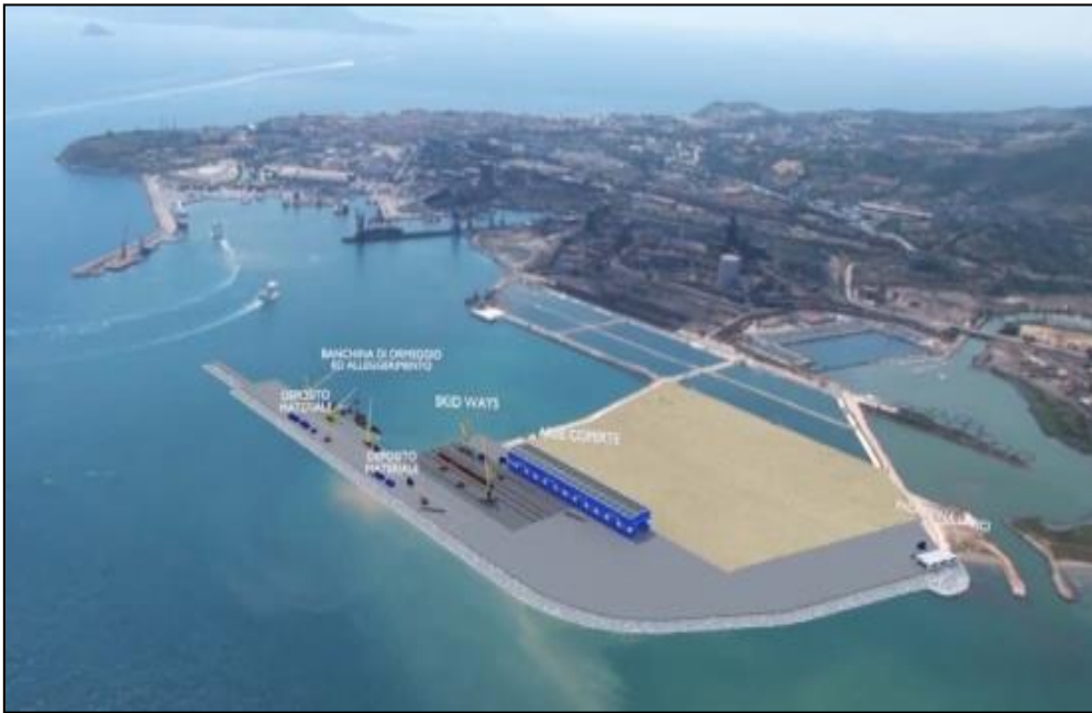
Rendering situazione finale