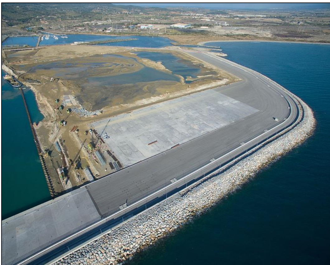
Situazione a Novembre 2017