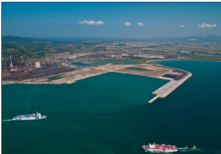
Situazione Ante -opera 2016

L'importo lavori a seguito di gara, al netto del ribasso offerto, è pari ad € 17.820.657,60 comprensivo degli oneri per la sicurezza che ammontano ad € 300.000,00 e di € 264.000,00 per la progettazione definitiva e esecutiva, entrambi non soggetti a ribasso.