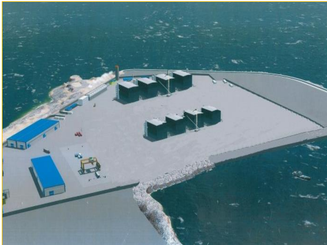
Rendering situazione futura

Il tempo complessivo necessario per realizzare le opere infrastrutturali sopradescritte è stato stimato in circa 18 mesi naturali e consecutivi per la realizzazione di tutte le opere underground a cui andranno sommati ulteriori 12 mesi per la realizzazione delle opere overground a cura del futuro concessionario dell'area.